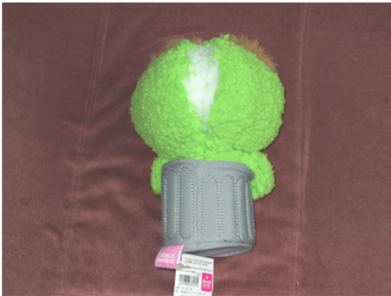
縫い目を探してアンテナのボール部分が入るよう少し大きめにほどきます。